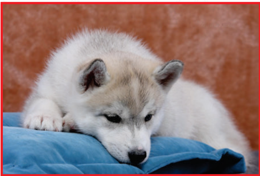
SH / Vrh „M“ CHS Vendredi 13, maj. Kinclovi Vladimír a Iva

U primárního typu cukrovky, kdy je nutné podávat nemocnému psovi inzulín (většinou 1 – 2x denně) je dieta mírnější a krmné porce by měly být menší.