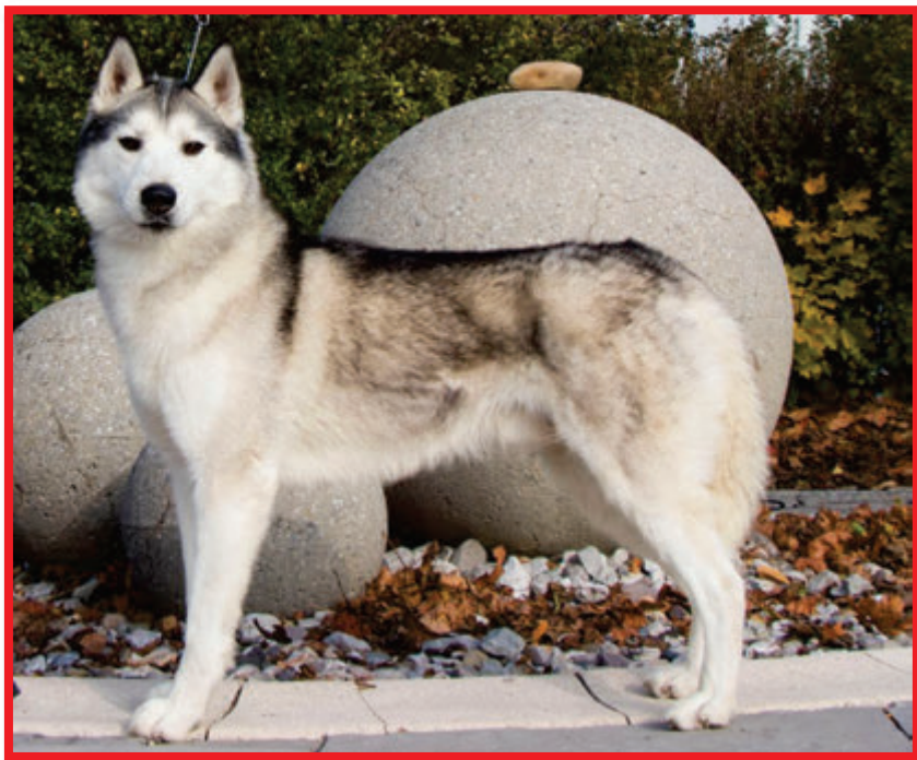
Erkil Ice flower