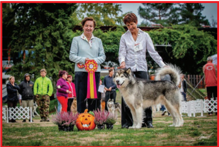
AM / BEST Veteran - Enormous Nugget Polární úsvit, maj. Kynclovi Z. a S.