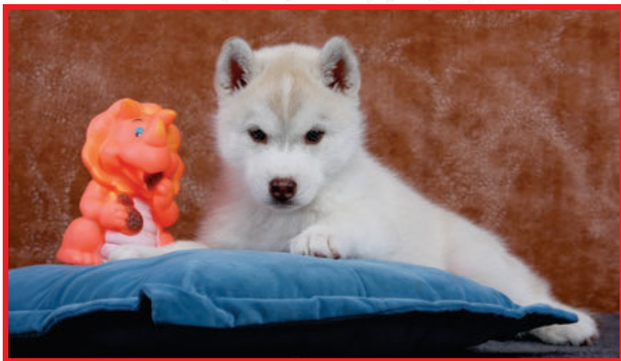
SH / Vrh „M“ CHS Vendredi 13, maj. Kinclovi Vladimír a Iva

S identifikací věci nebude zpravidla problém v případě prodeje jednoho mláděte.