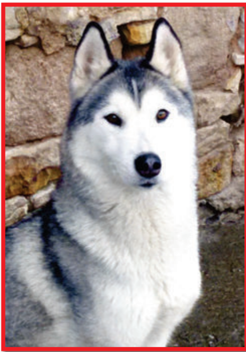
Egeria Ice flower

Egeria Ice flower , šedobílá hnědooká fena, jediná fenka ve vrhu, takže od jejího narození bylo jasné, že zůstává ve smečce a od malinka to byla naše rozmazlovaná princezníčka (v podstatě stejně jako její maminka). Egi je poměrně dominantní fena, ještě než dosáhla jednoho roku, převzala vůdčí postavení ve smečce. Celkově je vrh E podstatně dominantnějších povah než předchozí vrh D. Egi svojí povahou hodně připomíná svojí praprababičku Marion z Uvaláku. Z výstavních titulů zatím stojí za zmínku Český junioršampion a Český šampion. Bylo v plánu, že se stane matkou našeho dalšího vrhu, ale vzhledem k jejímu současnému věku leží budoucnost naší chovatelské stanice na jejím bratru Erkilovi.