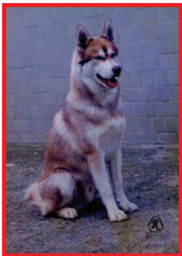
Agis Ice flower