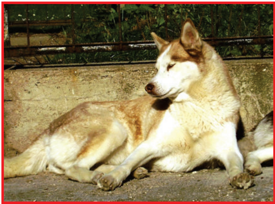
Cassandra Ice flower