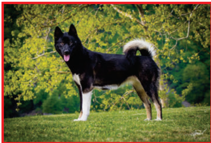
GP / Ch. Black Star Třpytivý sních, maj. Galgaňáková Yvona