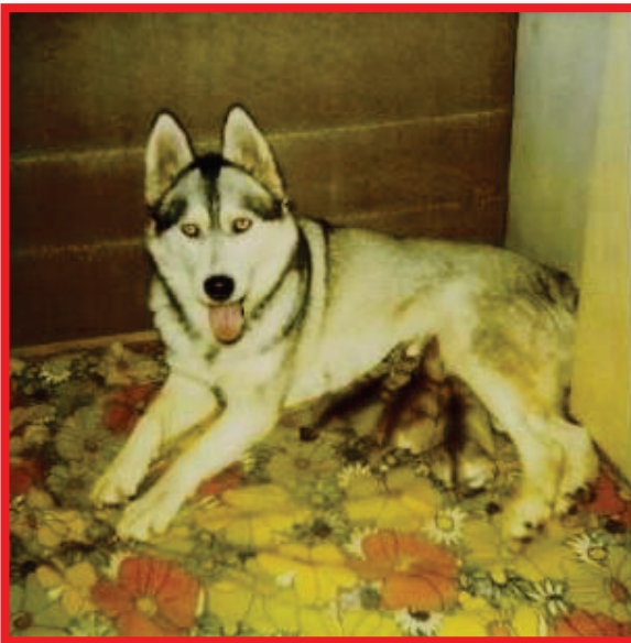
Quintana z Úvaláku