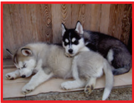
Donar a Dagan Ice flower

Dalším možným ujednáním je výhrada lepšího kupce. Prodávající má při této výhradě právo dát přednost lepšímu kupci, přihlásí-li se v určené lhůtě, která