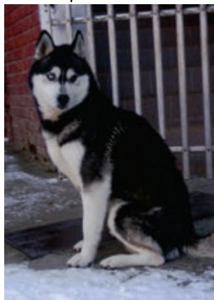
Donar Ice flower

Ucho psa je utvořeno tak, že má samočisticí schopnosti. Srst v oblasti vnitřního ucha slouží k ochraně před proniknutím cizích těles, např. obilného zrna apod. Zvukovod psů i koček je jiný než u lidí. Je mnohem tenčí, více zaúhlený a kromě toho také delší. Když se snažíme uši psa vyčistit třeba vatovou tyčinkou, stává se pravidelně, že veškeré nečistoty zatlačíme ještě hlouběji, což může mít