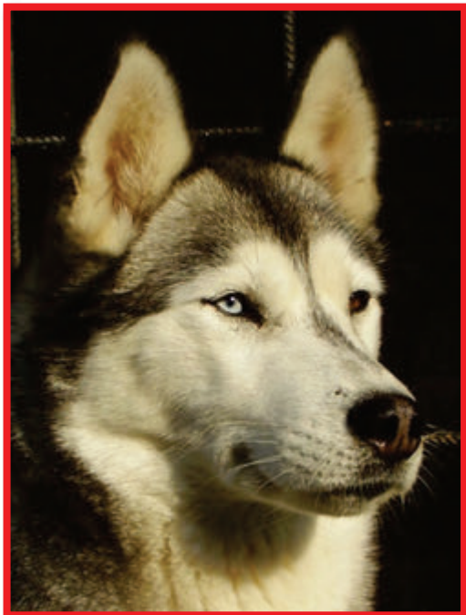
Daverra Ice flower