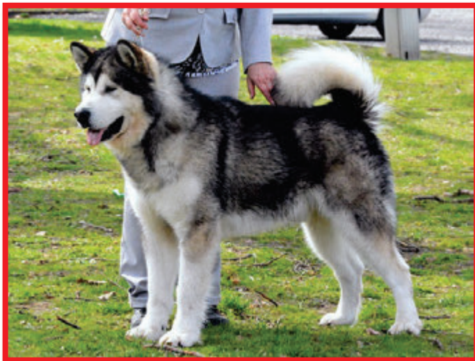
AM / Ch. Fuego Třpytivý sníh, maj. Galgaňáková Yvona