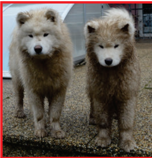
Podzim a samojedi, CHS Vidnavská záře

To, jak pejsek nízké teploty zvládá, se odvíjí od mnoha faktorů, například na jaké teploty jsou zvyklí, také od stáří, plemena či obvyklé pohybové aktivity. Třeba štěňata by v mrazech neměla být dlouho venku hlavně z toho důvodu, že ještě nemají vyvinuté plnohodnotné osrstění. V případech extrémních mrazů zkráťte délku pobytu venku na minimum a podívejte si účelu. Za zvážení stojí i psí oblečky. U některých psů se nejedná pouze o módní výstřelek, ale praktický doplněk z nutnosti, který udržuje záda a bedra v teple. Nejvíce ho využijí choulostivá plemena s nedostatečnou hustotou srsti. Bude-li přát počasí, ani v zimě se nemusíte vzdávat dlouhých procházek a výletů. Při delších výletech oceníte šikovné pomocníky, například tašky na nošení, které se