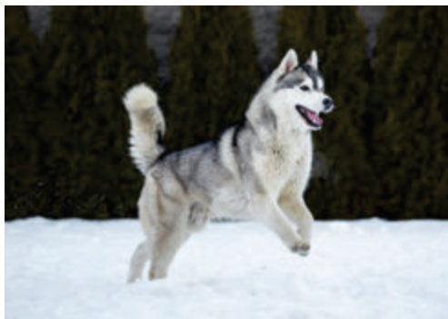
CIB Multi CH Elite BG's Phantasia de Zakouma